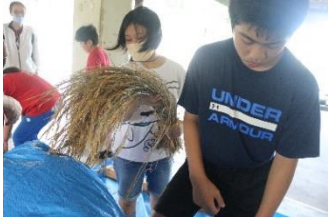
中1も参加しました！

次は、この精米した「有銘米」をどうするか！また、子供達のアイデアで学習を進めて参ります。楽しみにされていくください。有銘・慶佐次の地域と「米づくり」を通して更につながる学校づくりに努めていきます。今後ともよろしく願っています。