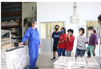
羽地ライスセンターにて