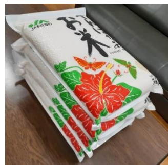
JA羽地ライスセンターさんのご厚意で真空パックに！