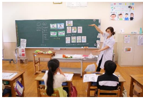
【3. 4年生 野菜を食べよう】