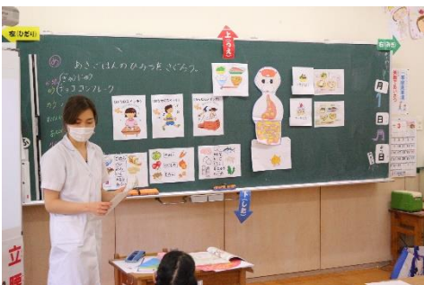
【1. 2年 朝ごはんのひみつをさぐろう】

3月1日月曜日に東村立給食センターの栄養士を招いて、全学年に栄養指導を行いました。日頃の食事についてみんなで話合ったり、意見を出し合ったり、いつもの授業と違った指導にみんな目を輝かせていました。それぞれが将来に向けて、食事について考えるよい機会となりました。