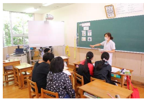
【5. 6年生 生活習慣病について】