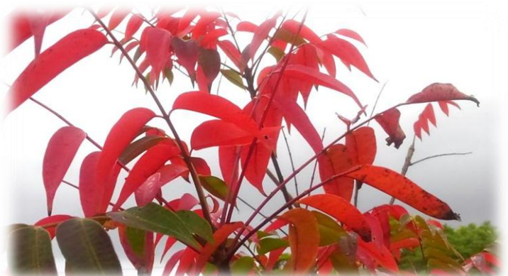
ハゼノキ 学名：Toxicodendron succedaneum ウルシ科 別名：リュウキュウハゼ

今年のサクラはいったいどうしたんだろう？と心配していたが、今、まさに花盛りで満開！小鳥やミツバチたちもさぞ喜んでいることだろう。