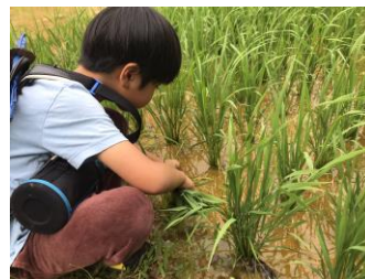
カエル! 雨に「ケロケロ」