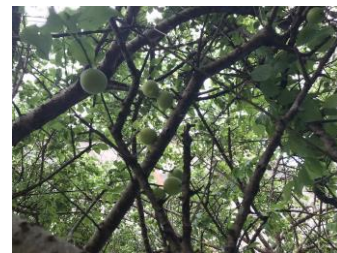
校内に実った梅の実