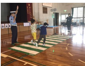
横断歩道のわたり方練習