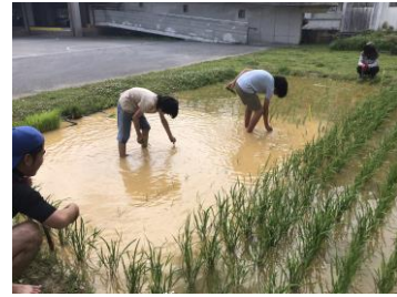
校内の水田 田植え