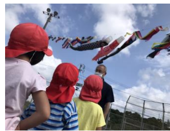
園児は一足さきに村営グラウンドでこいのぼり掲揚

今年のアルメンジャー青は図書委員会も行います。その企画の一つとして、こいのぼり集会を行いました。水田の上に、青空の中、こいのぼりが子どもたちを見守ります。幼稚園児は、先週に続き、二度目の掲揚式です。