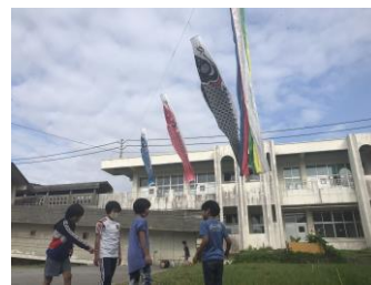
校内のこいのぼり