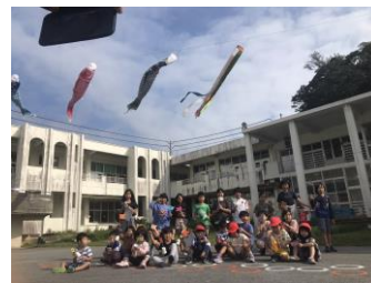
子どもたちとこいのぼり